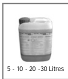
5 - 10 - 20 - 30 Litres

Produit inflammable. Respecter les consignes de sécurité mentionnées sur l'étiquette. Procéder à un essai de compatibilité avant utilisation.